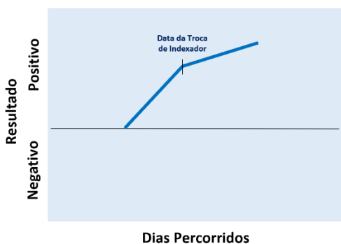
Troca de Indexadores